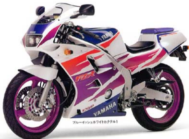
ブルーインストカラータイプ1